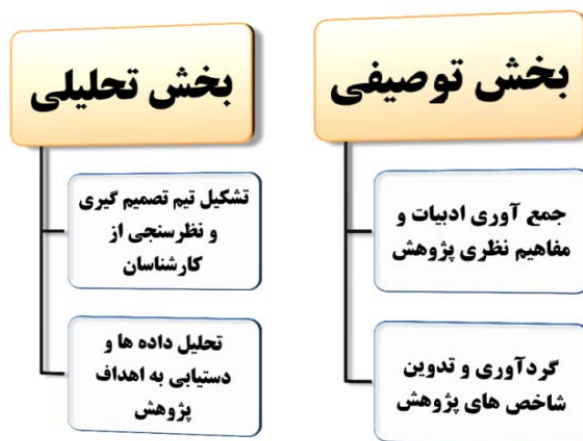
شکل ۲. فرایند اجرای پژوهش

در نهایت برای تحلیل داده‌های پژوهش متناسب با اهداف تعیین شده یعنی ارزیابی میزان اولویت پیشران‌ها و شاخص‌های پایداری گردشگری شهری در شهر اهواز از رهیافت شبکه عصبی پرسپترون چندلایه و ارزیابی میزان تأثیر پیشران‌ها و شاخص‌های پایداری در فرایند پایداری گردشگری شهری در شهر اهواز از مدل‌های رگرسیونی خطی، لگاریتمی و لجستیک استفاده گردید.