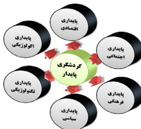
شکل ۱. پایداری در گردشگری شهری و ابعاد آن (چوی و سیراکایا، ۲۰۰۶؛ اویولا و همکاران، ۲۰۱۲)

از سوی دیگر مطابق مطالعات بانک جهانی برای تثبیت جایگاه گردشگری به عنوان زبان واحد توسعه در مرزهای دور، توجه به پایداری پیشران‌های سیاسی و فرهنگی به عنوان پیشران‌های کلیدی در رشد و شناسایی مقاصد گردشگری بسیار مؤثر است. در واقع، به اعتقاد محققان توجه به حوزه تحول‌آفرین گردشگری با یکپارچگی توجه و ممارست در پیشرفت پیشران‌ها و مؤلفه‌های تبیین‌کننده آن، اتخاذ تسهیلات سیاسی و با بهره‌گیری از توان تکنولوژی پیشرفته عصر حاضر امکان‌پذیر خواهد بود (اویولا و همکاران، ۲۰۱۲: ۶۶۲). شناسایی هویت بومی در قالب فرهنگ و تاریخ ملی؛ شناسایی و ارج نهادن به داشته‌های اجتماعی و طبیعی و توجه به رشد و تعالی اقتصادی از مهم‌ترین نکات توجه به پایداری در حوزه گردشگری ذکر شده است (باکلی، ۲۰۱۲: ۵۳۱). پیران‌ها و راهبردهای پیش‌برنده‌ای که به صورت زیرمجموعه یک سیستم، همدیگر را حمایت کرده و در پایداری سیستمی به نام گردشگری تأثیر به سزایی دارند.