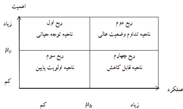
شکل ۱: ماتریس تحلیل اهمیت- عملکرد

چه میزان اهمیت برخوردار است؟ ب) عملکرد ارائه کننده خدمت یا محصول در ویژگی های مطرح شده از پرسشنامه چگونه بوده است؟ (بحرینی زاده و همکاران، ۱۳۹۳). اطلاعات مورد نیاز تحلیل اهمیت- عملکرد از پرسشنامه استخراج شده و میانگین یا میانه امتیازات اهمیت و عملکرد هر ویژگی محاسبه می شود و در نهایت این مقادیر به عنوان مختصات برای ترسیم ویژگی های جداگانه بر روی ماتریس دو بعدی به نام ماتریس اهمیت- عملکرد مورد استفاده قرار می گیرد (آذر و همکاران، ۱۳۹۵). شکل ۱، چهار ربع ماتریس تحلیل اهمیت- عملکرد را نشان می دهد.