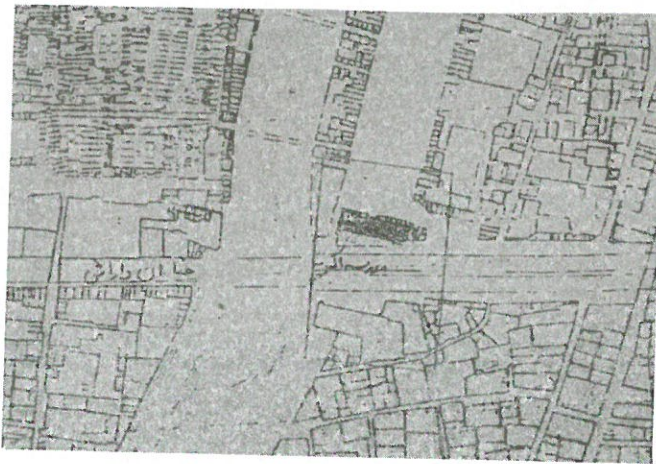
تصویر ۵ - قسمتی از بافت تاریخی تبریز، مدرسه اکبری که توسط خیابان دارایی به دو بخش تقسیم شده است.