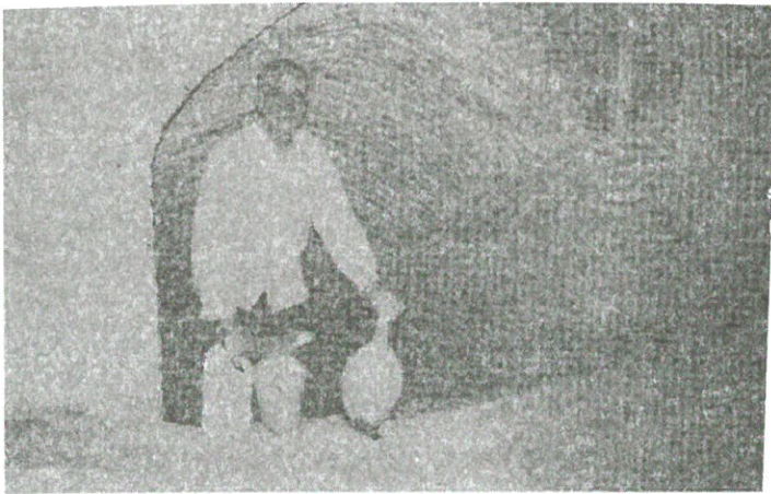
تصویر ۲ - آب انباری در بافت قدیمی نایین (عکس از اسماعیلی، شهریور ۱۳۸۳)