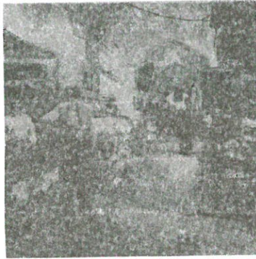
تصویر ۱ - نمایی از بازار سیرجان