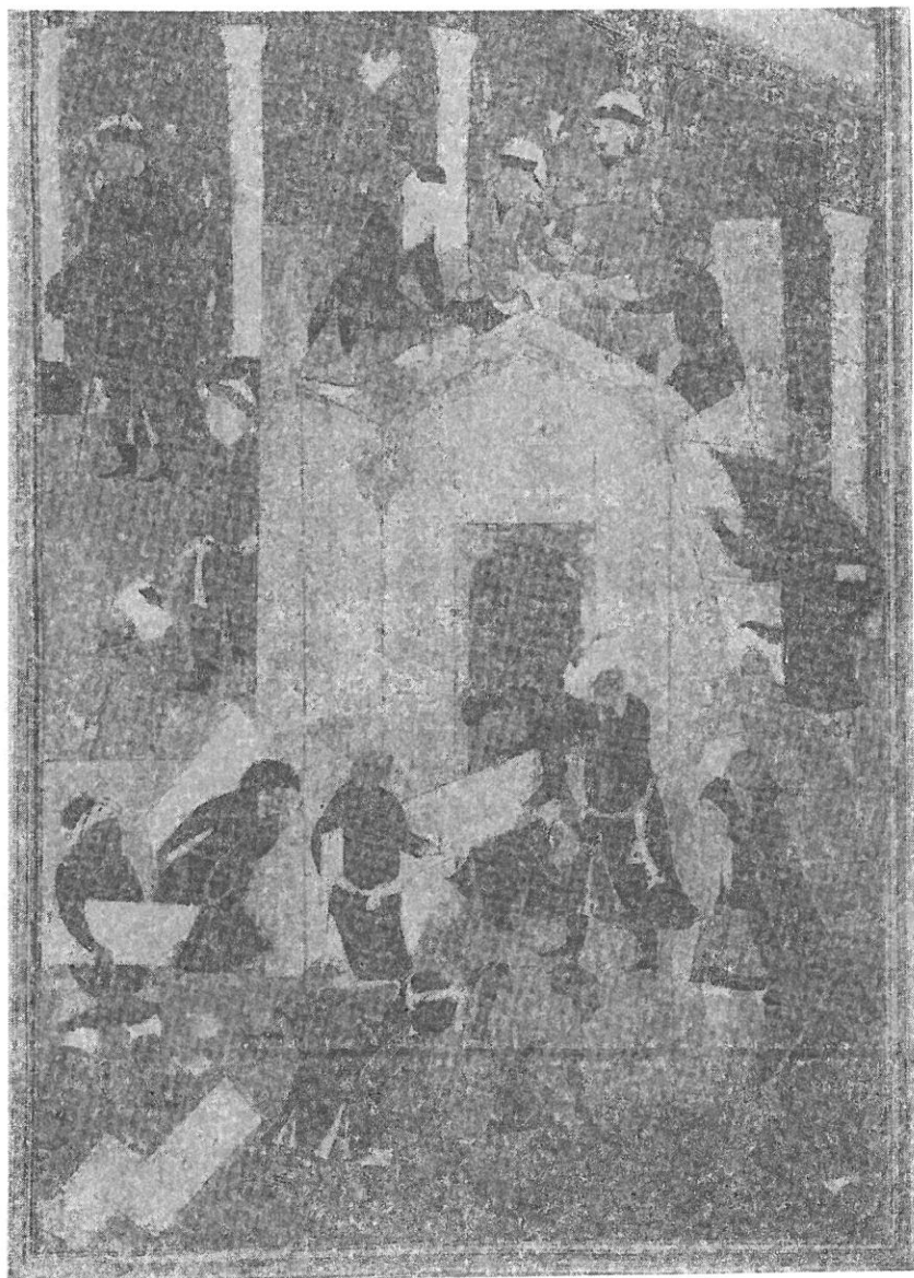
تصویر ۳ - نگاره‌ای از کمال الدین بهزاد (برگرفته از هنر معماری اسلامی ایران، صفحه ۳۷)