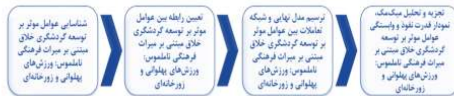
شکل ۱. مراحل انجام روش ساختاری - تفسیری (ISM)

در پژوهش حاضر، روایی سؤالات بخش دلفی در روش ساختاری - تفسیری به طریق محتوایی حاصل شده است. روایی صوری و محتوایی سؤالات در بخش دلفی توسط صاحب نظران و اساتید دانشگاهی تأیید شد. همچنین برای حصول اطمینان از پایایی پژوهش نیز از یادداشت برداری مفصل و دقیق و کدگذاری ناشناس به کمک کدگذاری که جزء تیم پژوهش نبود، استفاده شد.