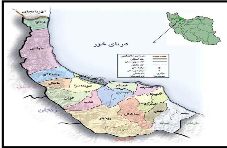
شکل ۱. موقعیت جغرافیایی استان گیلان

غفاری و همکاران (۱۴۰۰) در پژوهشی با عنوان «طراحی مدلی جهت بسط مفهومی کوچینگ عملکرد کارکنان در سازمان‌های دولتی ایران» به این نتیجه دست یافتند که به کارگیری تکنیک مربیگری در مدارس مزایایی از قبیل بالا رفتن اثربخشی آموزش‌ها، بهبود تعاملات و ارتباطات سازمانی، پرشدن شکاف میان حوزه نظر و عمل آموزش‌های سازمانی، کاهش هزینه‌های آموزشی و تبدیل سازمان به سازمانی پویا را به ارمغان می‌آورد.