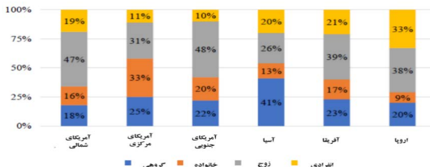
نمودار شماره ۱- ترجیح سفر برای گردشگران ماجراجو بر اساس منطقه جغرافیایی