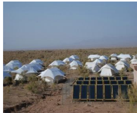
شکل ۳: تصویر ساختمان و چادرهای اکوکمپ