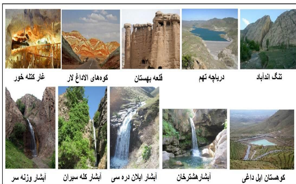
شکل ۲. نمونه‌ای از ژئوسایت‌های منطقه مورد مطالعه